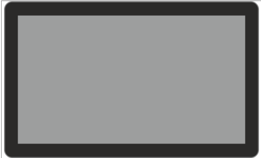
Versione hardware B